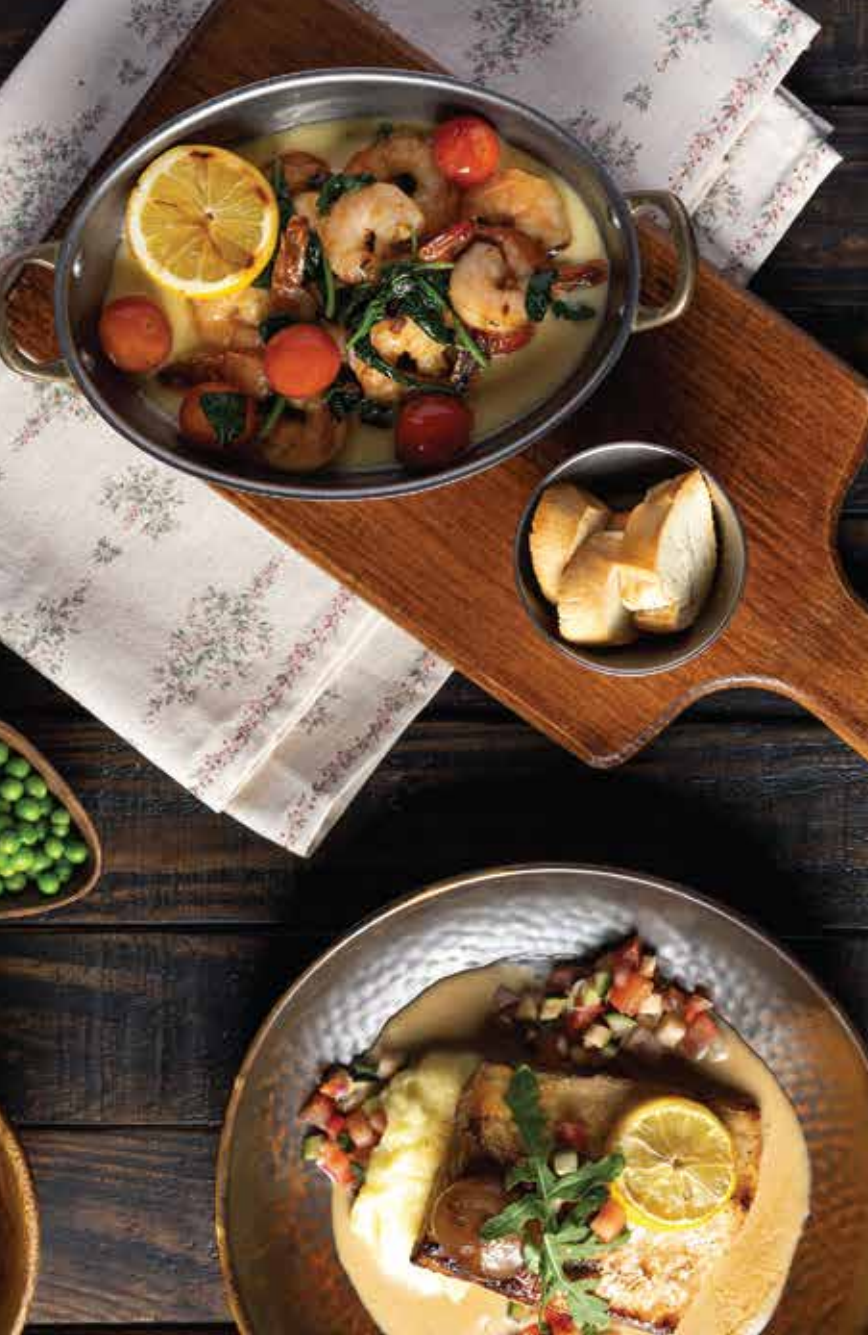
STERKO FILĖ KEPSNYS SU KARAMELIZUOTŲ SVOGŪNŲ PADAŽU, „PROSECCO“ KREKETĖS