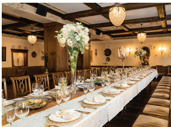
SENAMIESTIS, M. VALANČIAUS G. 9