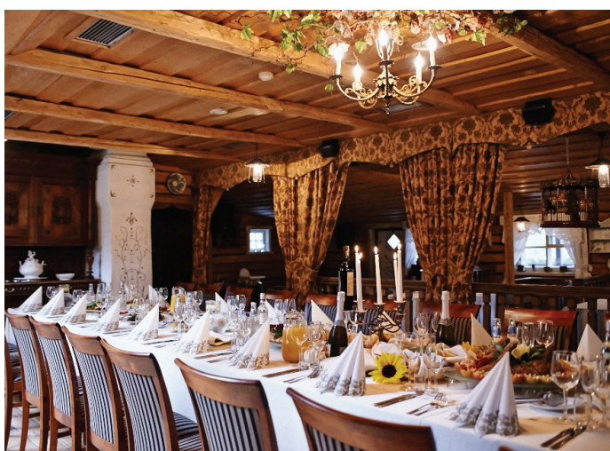
CENTRAS, K. DONELAIČIO G. 11