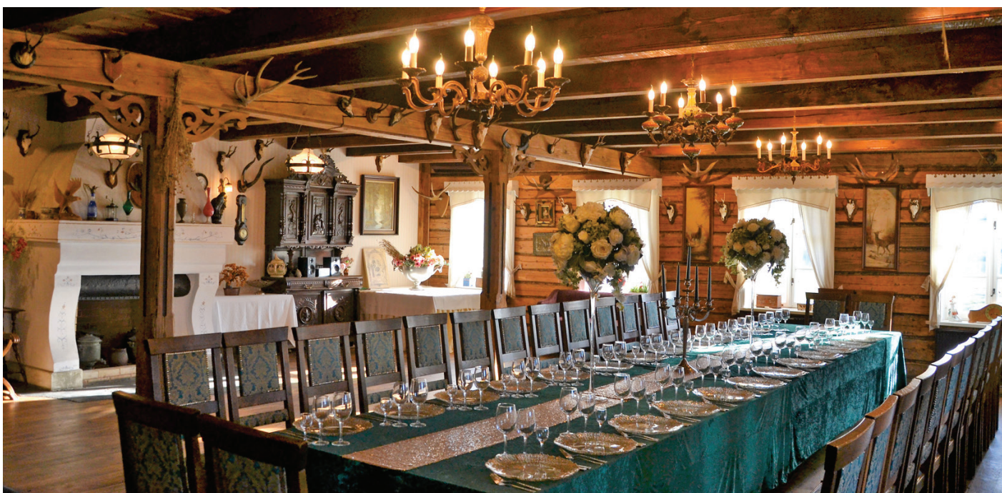
ŠILAINIAI, BALTŲ PR. 81