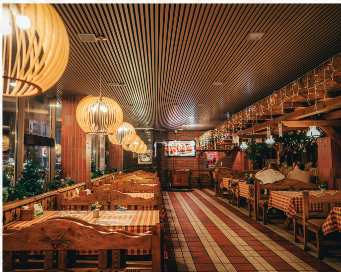
VILNIUS, J. LELEVELIO G. 6/ GEDIMINO PR. 19