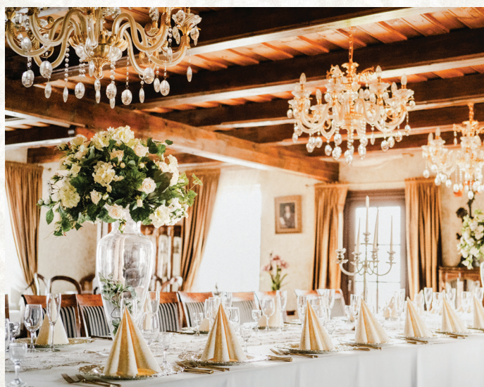
ŠILAINIAI, BALTŲ PR. 81